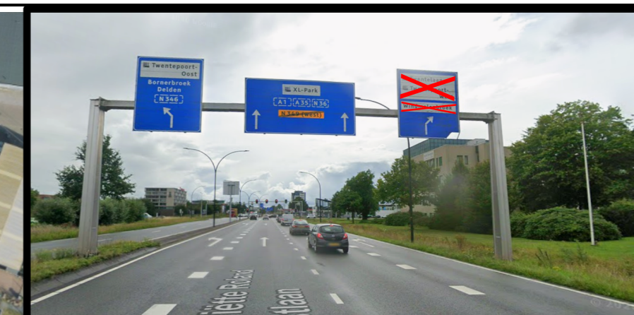
Tijdelijk buiten werking stellen