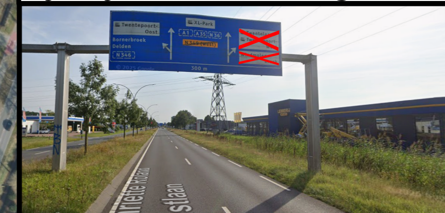
Tijdelijk buiten werking stellen