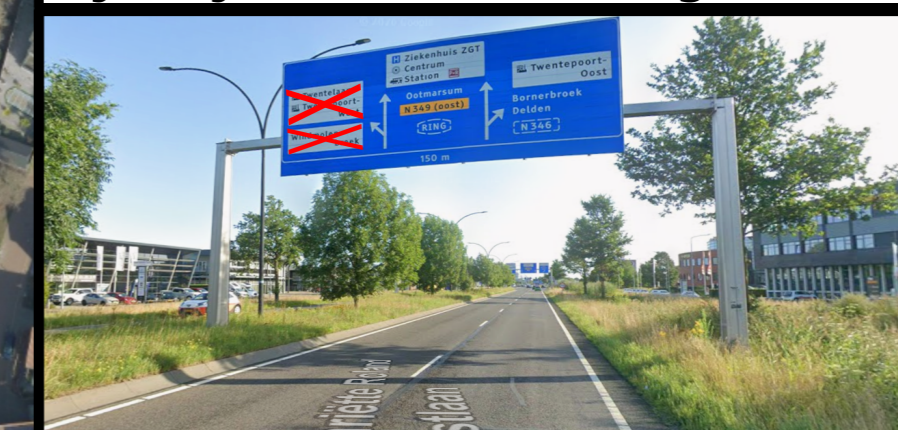
Tijdelijk buiten werking stellen