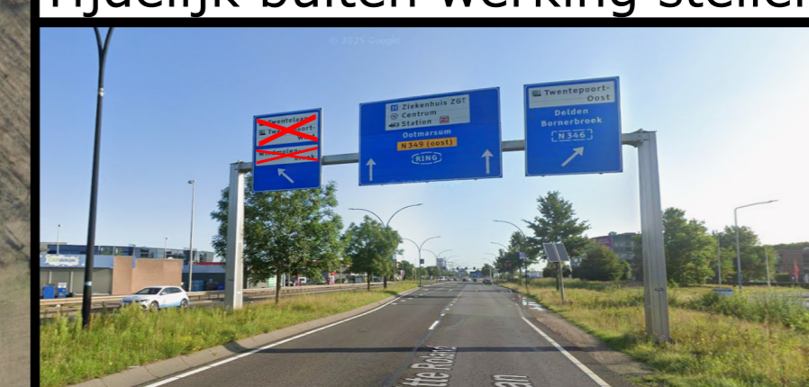
Tijdelijk buiten werking stellen