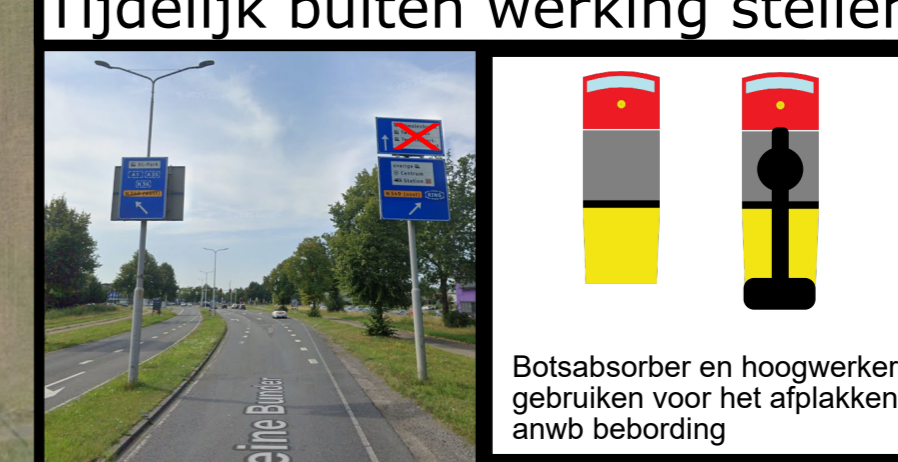
Tijdelijk buiten werking stellen